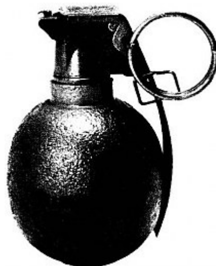
En kam för Wargh?