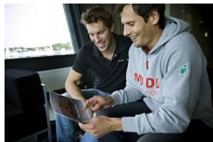
Kapten Svartvadet och Salomonsson har fått uppdraget att presentera sina lagkompisar för Allehanda medias läsare.

- Största huvudet med minsta hårddisken, men han har också det överlägset största hjärtat. Timander passar bra in i vårt kompisgäng, han är helt ovärderlig. Han kan uppfattas som disträ, men han prioriterar bara det han vill göra.