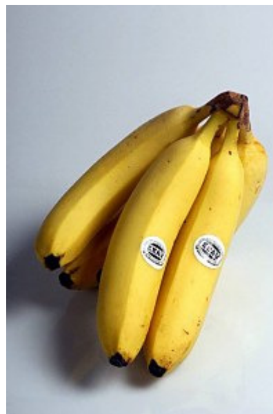
Det här gillar Hedin och Jonsson.

- En kanonkille. Hade han inte blivit hockeyspelare hade han sysslat med att klubba sälar någonstans ute på Nordsjön. Å andra sidan är hans spelstil snarlik sälklubning. Just nu försöker vi lura honom kvar i Ö-vik fram till nästa sekel. Per-Åge vägrade också spela VM i Ryssland.